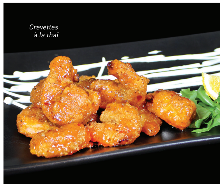
Crevettes à la thaï