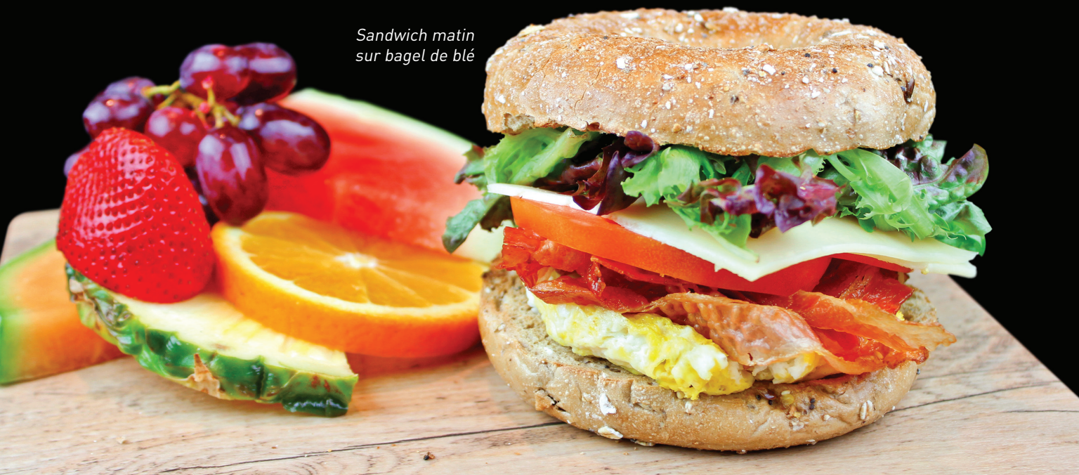
Sandwich matin sur bagel de blé