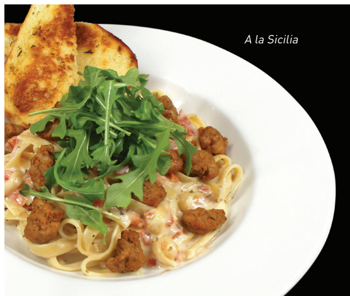
A la Sicilia