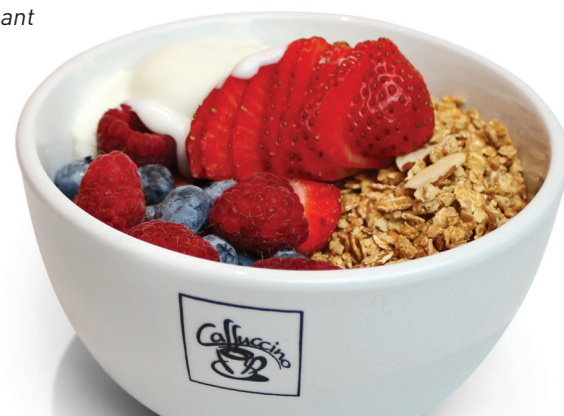
Bol croustillant des champs

Yogourt vanille, petits fruits des champs, croque nature Ajoutez un bagel de blé + fromage à la crème + 2.