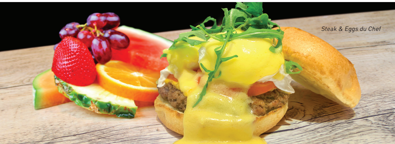
Steak & Eggs du Chef