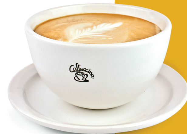
Bol de café au lait