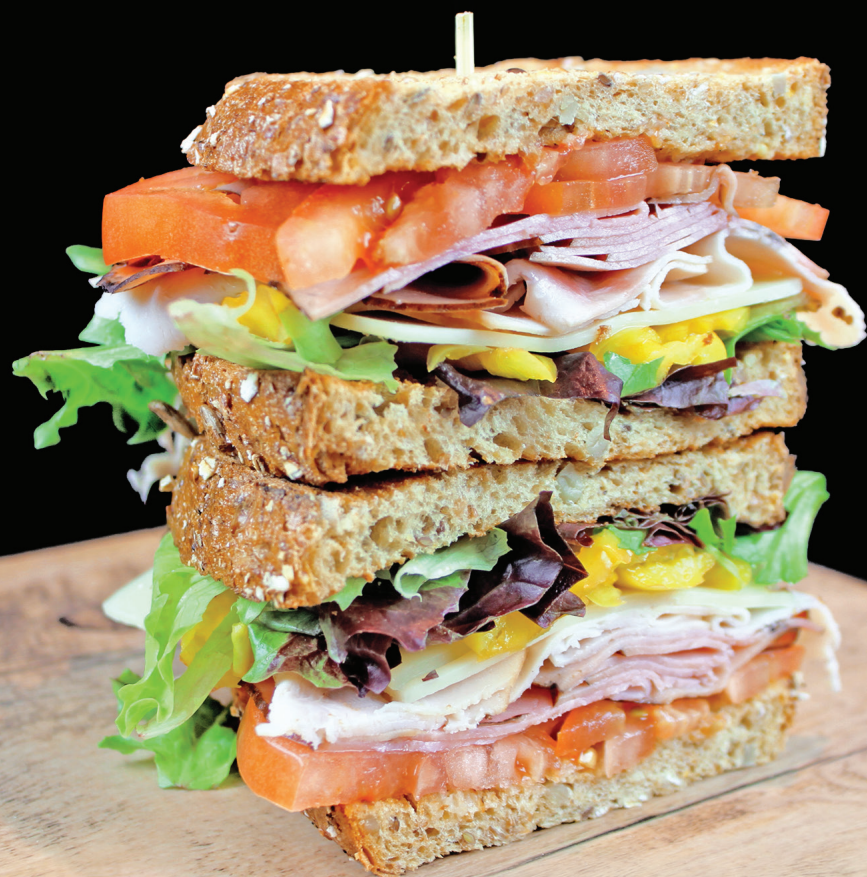
Le De luxe

Saumon fumé, fromage à la crème, oignons rouges, câpres, citron, sur bagel blanc ou de blé