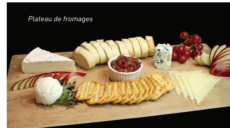
Plateau de fromages