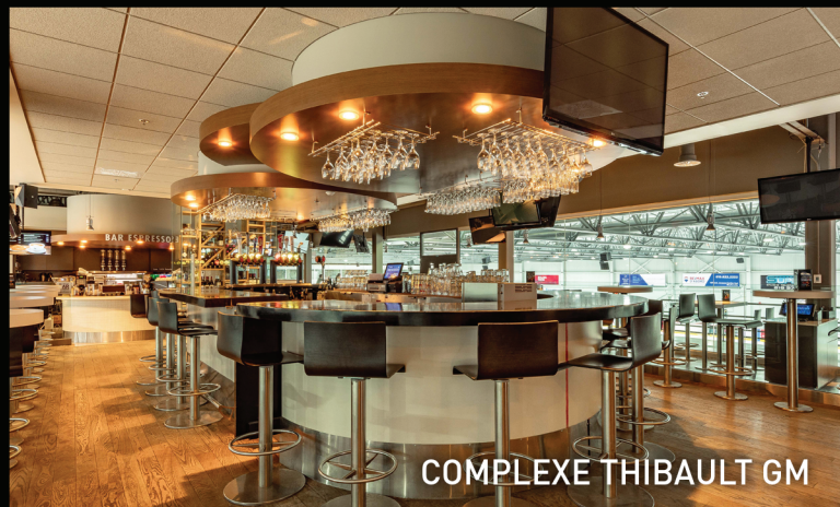
COMPLEXE THIBAUT GM