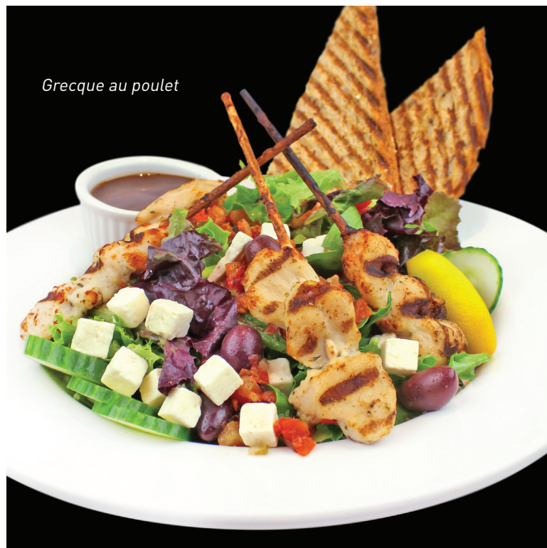
Grecque au poulet