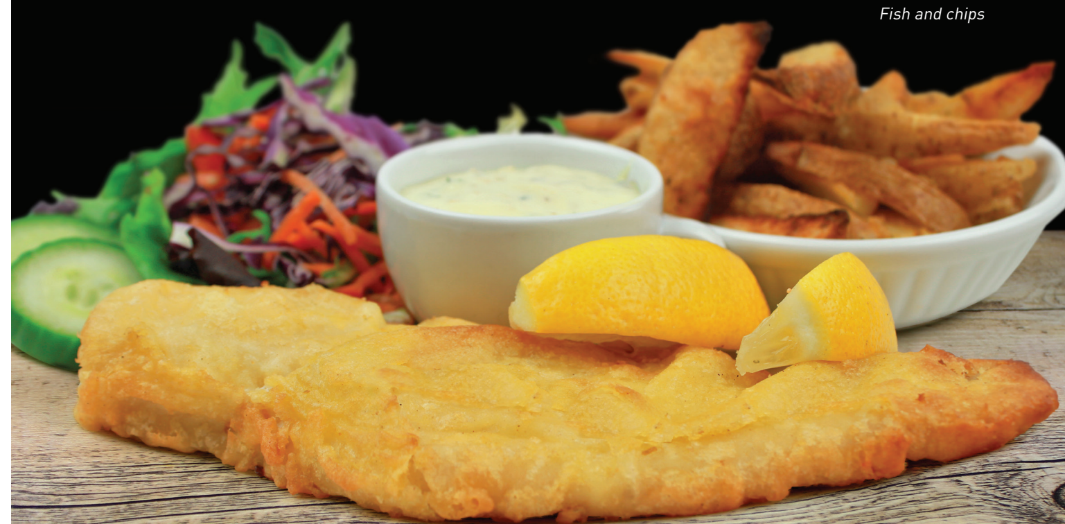
Fish and chips

AVEC CHOIX DE : saucisses italiennes grillées, brochette de crevettes, prosciutto grillé, satays de poulet grillé ou tofu