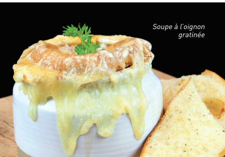
Soupe à l'oignon gratinée