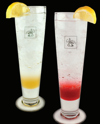
SODA À L'ITALIENNE Framboise, Pêche, Fruit de la Passion - 5.50 -