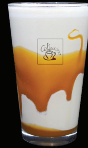
CAFÉ CAMEL frappé - 7.75 -