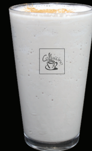
CHAI frappé - 7.50 -