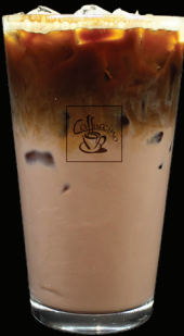
MOKA glacé - 7.00 -