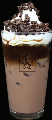
MOKACCINO glacé - 8.00 -