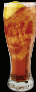
THÉ GLACÉ - 5.50 -