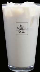
CHAI LATTÉ glacé - 7.00 -