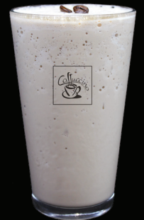
CAPPUCCINO frappé - 7.25 -