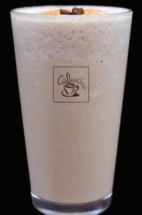
DIRTY CHAI frappé - 8.25 -