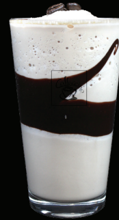
CAFÉ MOKA frappé - 7.75 -