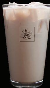
DIRTY CHAI glacé - 7.75 -