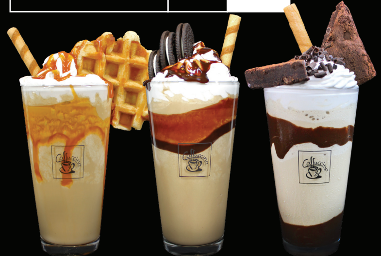
CAFÉ DULCE DE LECHE Café caramel frappé Crème fouettée Gaufre belge