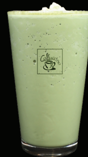
MATCHA frappé - 7.50 -