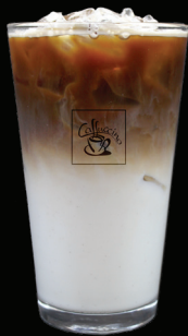
LATTÉ glacé (avec ou sans sucre) LATTÉ VANILLE glacé LATTÉ CAMEL glacé - 7.00 -