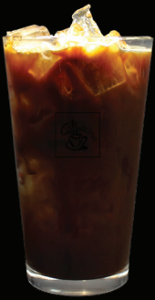
AMERICANO glacé - 4.50 -