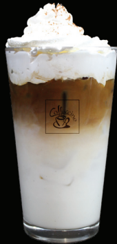
CAPPUCCINO glacé - 8.00 -