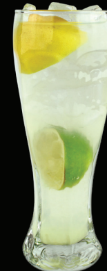
LIMONADE - 5.50 - aromatisée + 0.50