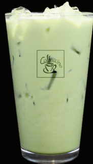
MATCHA glacé - 7.00 -