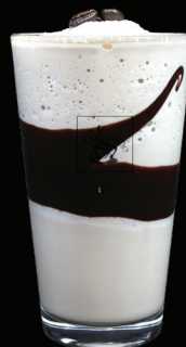
CAFÉ MOKA frappé - 7.75 -