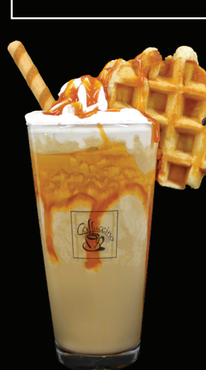
CAFÉ DULCE DE LECHE Café caramel frappé Crème fouettée Gaufre belge