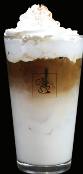
CAPPUCCINO glacé - 8.00 -