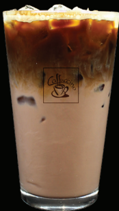
MOKA glacé - 7.00 -