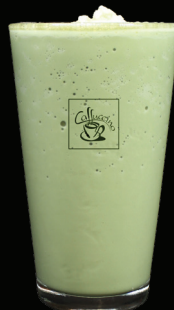
MATCHA frappé - 7.50 -