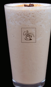
DIRTY CHAI frappé - 8.25 -