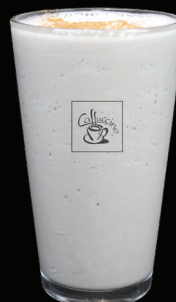
CHAI frappé - 7.50 -