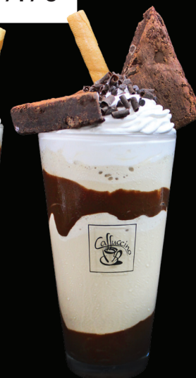
CAFÉ BROWNIES Cappuccino frappé Crème fouettée Copeaux chocolat noir Brownies