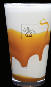
CAFÉ CAMEL frappé - 7.75 -