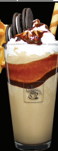
CAFÉ ORÉO Café moka frappé Crème fouettée Biscuits Oréo