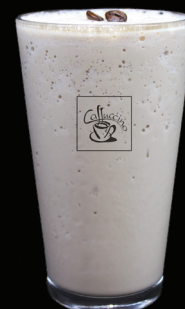
CAPPUCCINO frappé - 7.25 -