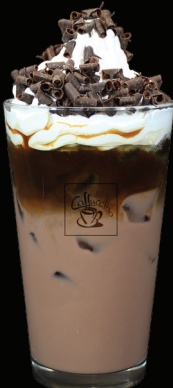
MOKACCINO glacé - 8.00 -