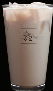
DIRTY CHAI glacé - 7.75 -