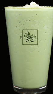
MATCHA frappé - 7.50 -