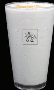
CHAI frappé - 7.50 -