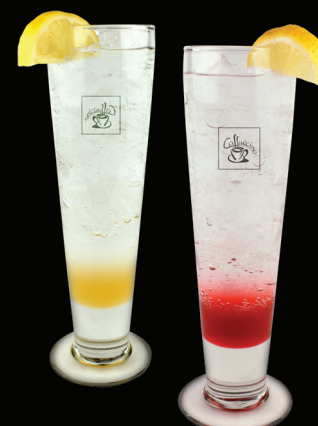
SODA À L'ITALIENNE Framboise, Pêche, Fruit de la Passion - 5.50 -