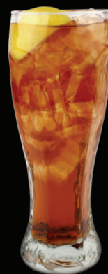
THÉ GLACÉ - 5.50 -