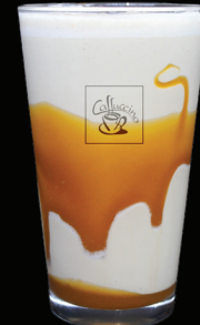
CAFÉ CAMEL frappé - 7.75 -