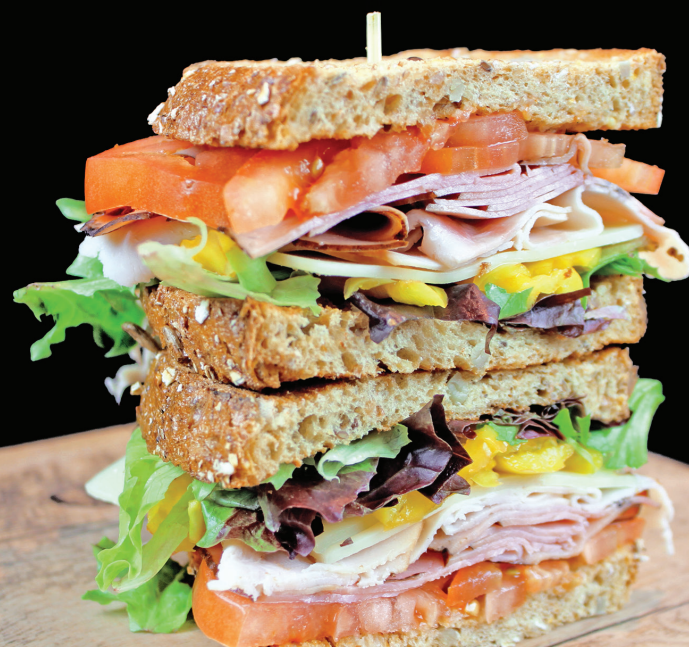
Le De luxe

Poitrine de poulet grillé, salsa, poivrons, piments forts, oignons rouges, mozzarella