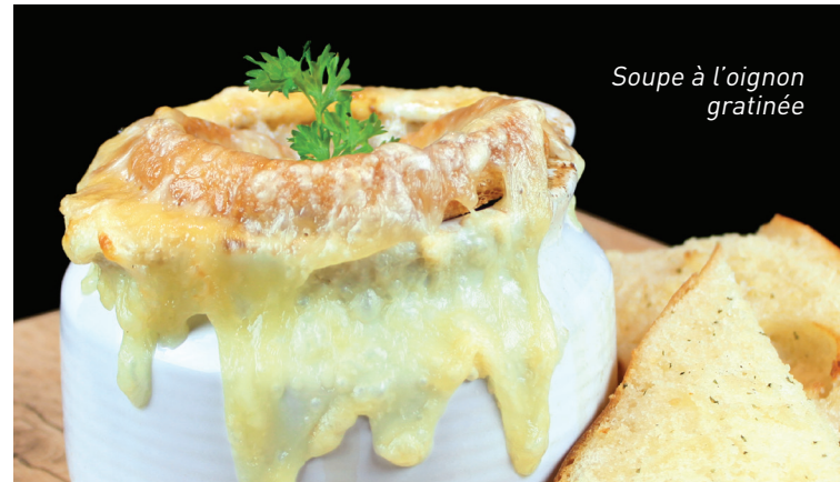
Soupe à l'oignon gratinée