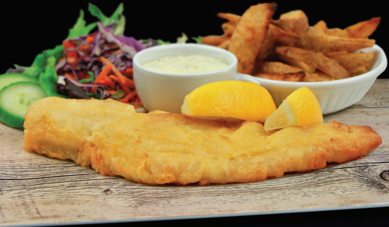
Fish and chips

AVEC CHOIX DE : saucisses italiennes grillées, prosciutto grillé ou satays de poulet grillé