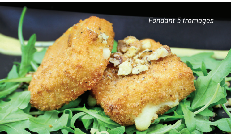
Fondant 5 fromages