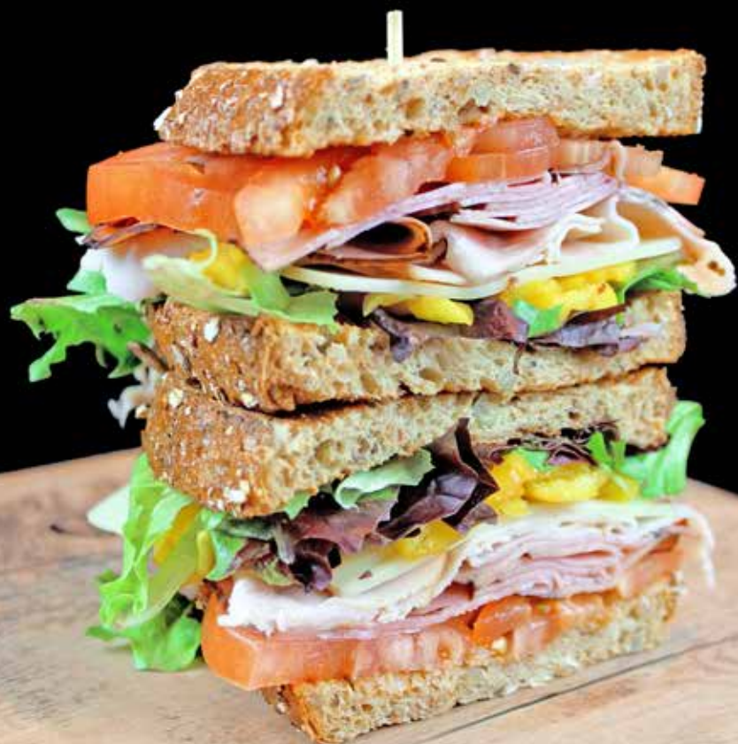
Le De luxe

Jambon, dinde fumée, mesclun, tomates, fromage suisse, piments forts, mayonnaise, moutarde douce, sur pain artisanal blanc ou multigrains