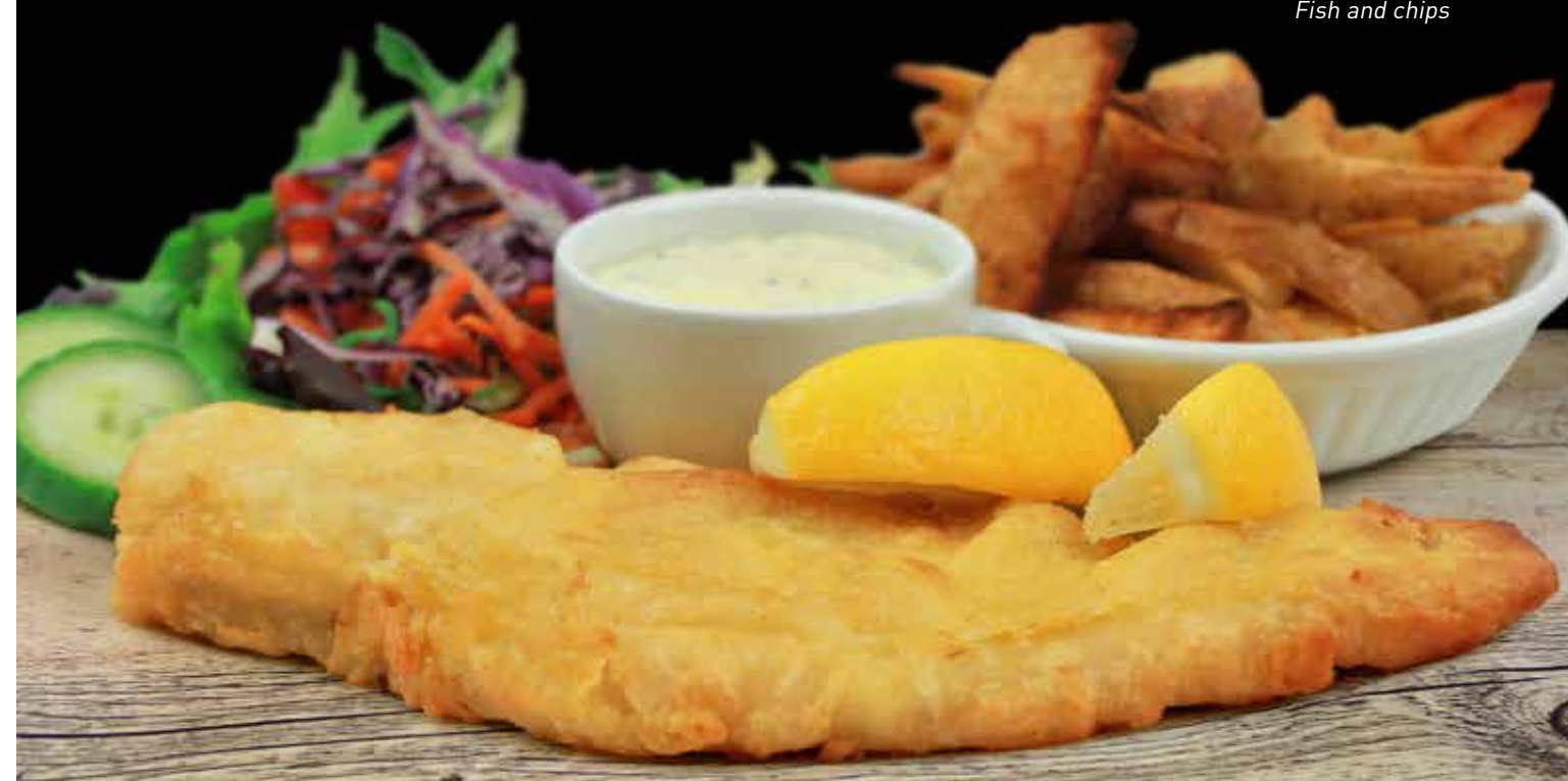
Fish and chips

Double viande, double cheddar jaune, bacon, mesclun, tomates, sauce maison