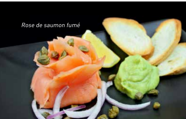
Rose de saumon fumé