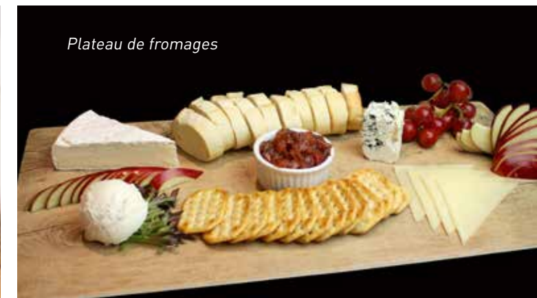
Plateau de fromages