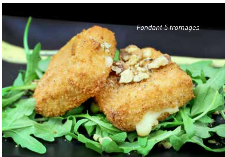
Fondant 5 fromages