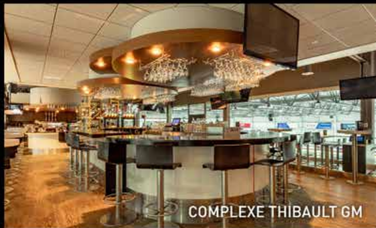
COMPLEXE THIBAUT GM

RESTAURANT • BISTRO BAR ESPRESSO SERVICE DE TRAITEUR BOUTIQUE CAFÉS BOITE À LUNCH