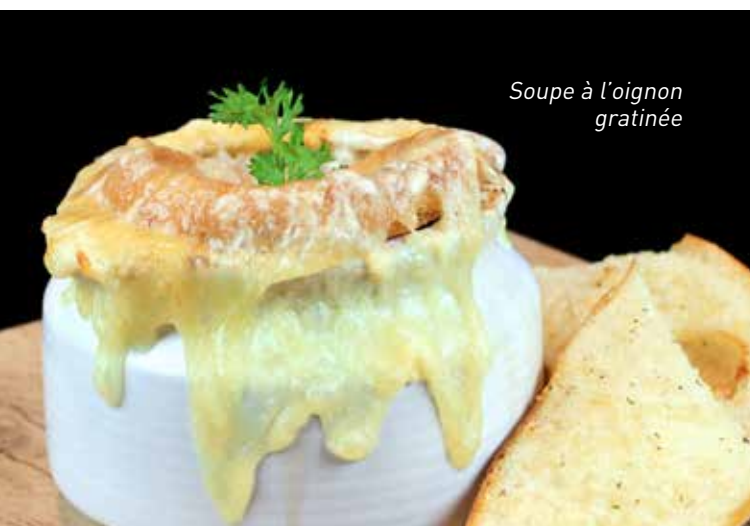
Soupe à l'oignon gratinée