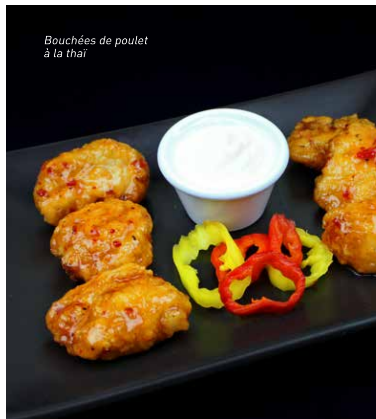
Bouchées de poulet à la thaï